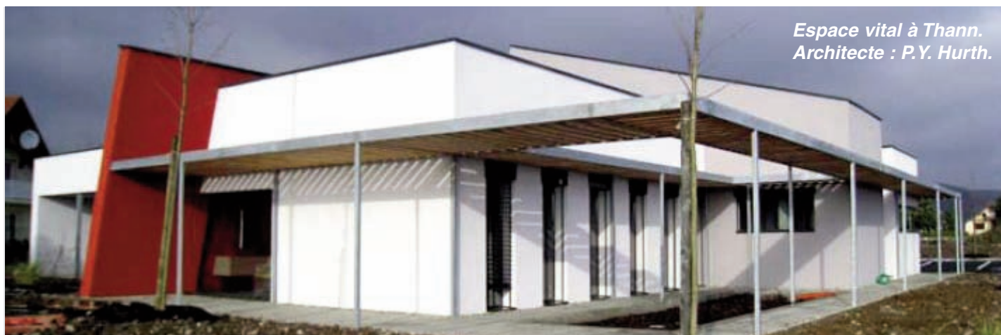
Espace vital à Thann. Architecte : P.Y. Hurth.